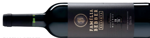
FAMILIA BEBBER RESERVA MALBEC