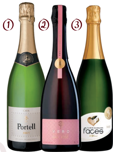
① CAVA PORTELL BRUT D.O ② FAMILIA BEBBBER VERO BRUT ROSÉ ③ LIDIO CARRARO FACES DO BRASIL BRUT