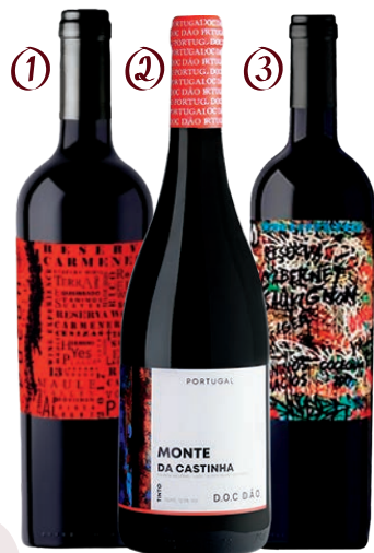
① PUCÓN RESERVA CARMENERÉ ② MONTE DA CASTINHA D.O.C. DÃO ③ SIDEWAY RESERVA CABERNET SAUVIGNON