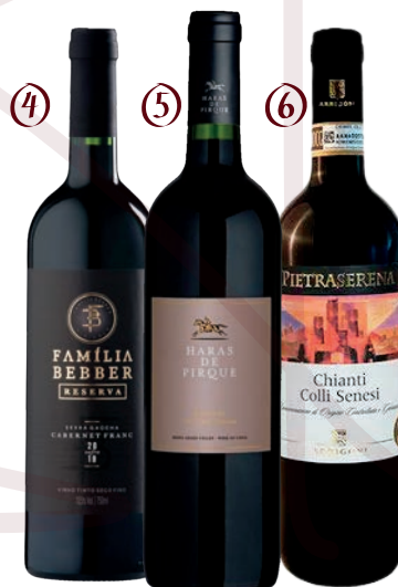
④ FAMILIA BEBBER RESERVA CABERNET FRANC ⑤ HARAS DE PIRQUE RESERVA DE PROPIEDAD ⑥ PIETRASERENA CHIANTI COLLI SENESI D.O.C.G.