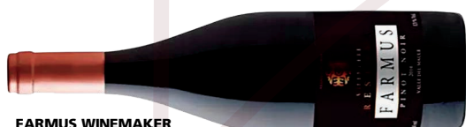
FARMUS WINEMAKER RESERVA PINOT NOIR