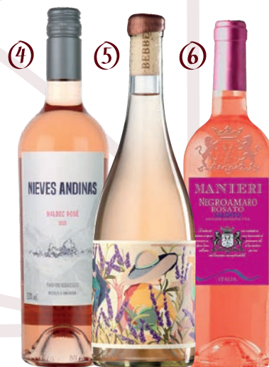
④ NIEVES ANDINAS MALBEC ROSÉ ⑤ FAMILIA BEBBBER ROSÉ ⑥ MANIERI NEGROAMARO ROSATO SALENTO IGT