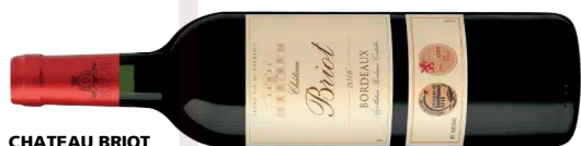
CHATEAU BRIOT BORDEAUX