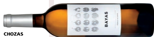
CHOZAS CARRASCAL BAYAS BRANCO

Nhoque de mandioquinha com camarões ao molho vermelho e folhas de espinafre.