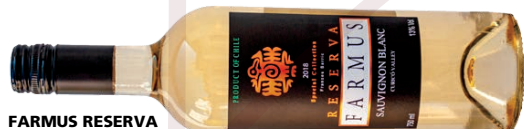
FARMUS RESERVA SAUVIGNON BLANC

Generosa porção de camarões rosa ao molho de leite de coco com polpa de abacaxi gratinado.