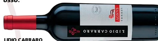
LIDIO CARRARO AGNUS TANNAT

Corte premium que reúne o marmoreio (gordura entremeadada) e o sabor especial dos cortes com osso.